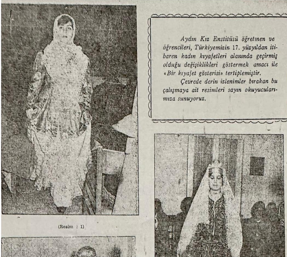
(Resim : 1)