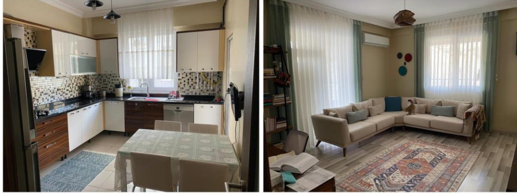
Figure 2: The living room and kitchen of Bahar's home in Yenişehir