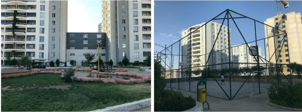
Reference: (Author, 2021)

The second change was the residents' activities in the garden and discussions on spatial suggestions. The gated community called 'Decor City' consists of three blocks each having nineteen floors with four apartments on each floor. Residents started to spend more time in communal areas with their families and neighbors even though they didn't do so before the pandemic. On the other hand, the gated community is both homogenizing and economically comparable. Due to the fact that this is a centrally managed facility, rules and regulations were implemented by an appointed complex manager. For example, when the managing executive proposed the re-opening of the gym, even though Medya opposed the idea, she was informed that if the majority agreed public areas such as pools, saunas, and Turkish baths would remain idle, as residents continued to have intense discussions about their maintenance. Monetary equivalence was not enough for gated community life, and it is necessary to provide conditions of sociocultural similarity. Similarities and discourse are generally inherent within community life. “In powerful detail and many persuasive arguments, people are explained how to live, what and why to choose, how to use their time and space to “live well” and make the most of opportunities” (Lefebvre, 2010: 33).