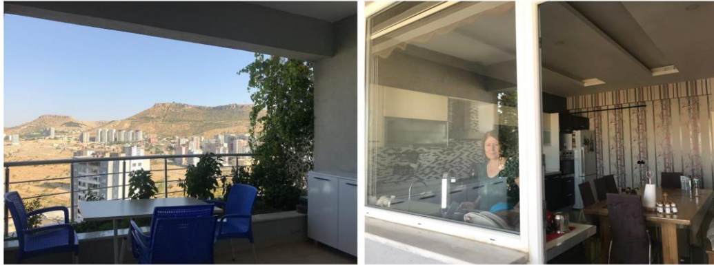
Figure 3: Medya's home: A view from the kitchen's balcony and a photo from the balcony to the kitchen