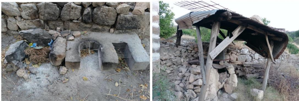
Figure 7: The wood fire oven and tandoor indicate the daily life practices of rural life

In the past, scorpions were rarely seen however as soon as restoration work began, they could be more readily observed. Perhaps this was due to the disturbance of their habitat. When the house repair started, the scorpions began to come out; I guess we changed their places too. A higher number of bees and ants are also present. When water levels were limited, they could become aggressive and attack when we were outdoors on the terrace. (Sibel, 21 y., student).