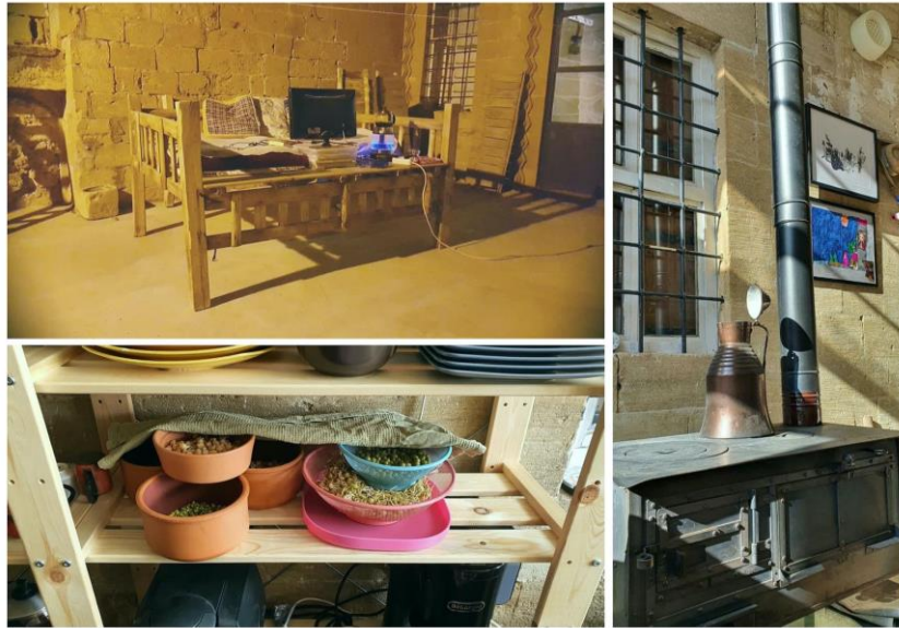
Reference: (Tuba, 2020)

Figure 6: Some photos from Tuba's home. The terrace, larder, and wood stove are indicative of the seasonal daily practices in Old Mardin