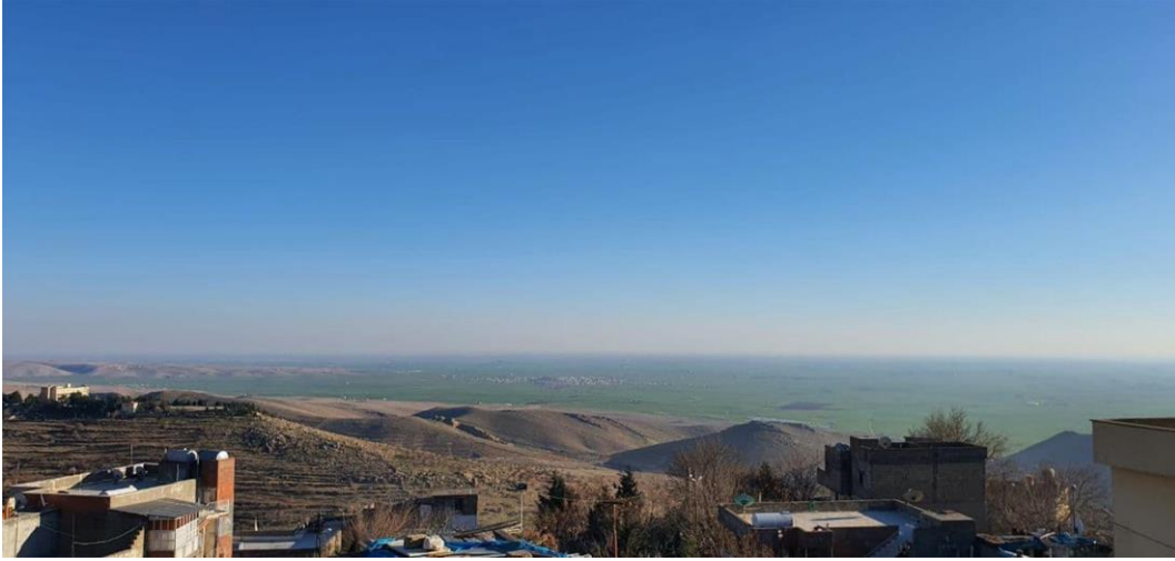
Figure 1: A Mesopotamian view from Tuba's home in Old Mardin