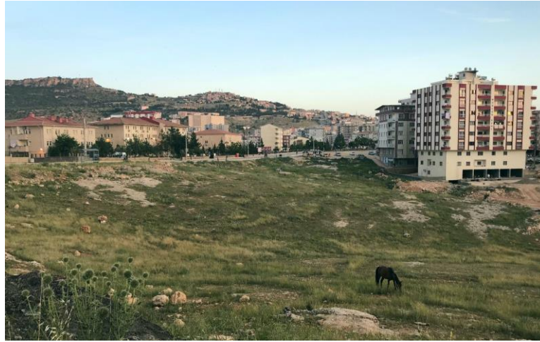
Figure 5: A rurban (rural-urban) view from Mardin, Yenişehir