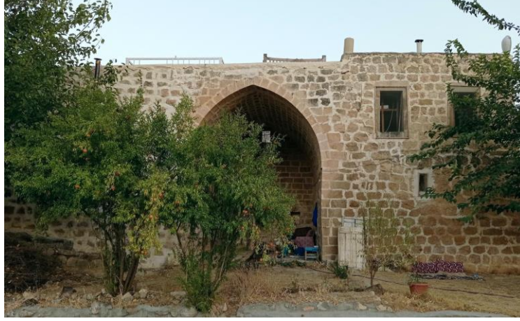
Figure 4: The iwan photo of Sibel's home in Bakırkırı

solutions to remain with them. For example, identifying the spot with the strongest connectivity and accessing the internet from there. (Sibel, 21 y., student).