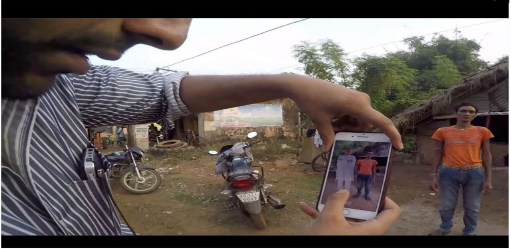
Bir Avantari teknisyeni, AR hologramıyla bir seçmenin fotoğrafını çekiyor.