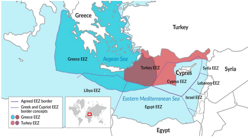
Map 6: EEZ Borders Claimed by Countries in the Eastern Mediterranean

Source: Prince Michael of Liechtenstein, GIS REPORTS, Turkey's complicated position in the Mediterranean Sea, September 2, 2020 (Liechtenstein 2020).