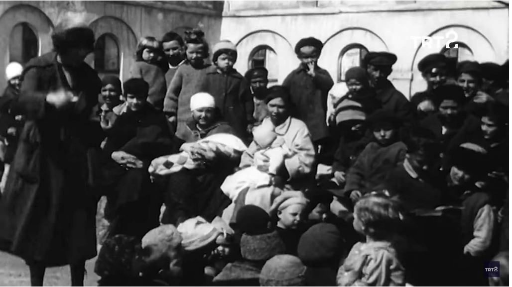
Fotoğraf 3: TRT 2 Tarihın Ruhı Adlı Belgeselin 4. Bölümü İstanbul’a Göç Eden Ruslar, 1921 Tarihli Görüntüler; 1:20. Saniye

Rus mültecinin babasından aktardığı bu nasihat kadim İslam-Türk geleneklerinde “tebaaya sağlanan inanç özgürlüğü, mazlumun yanında olmak ve mağduru korumak” öğretisinin bir devamı niteliğindedir. Bilindiği üzere Fatih Sultan Mehmet’in İstanbul’u fethi sırasında Bizans imparatoru Batı’yı harekete geçirmek için 12 Aralık 1452’de Ayasofya’da papa ile daha önce imzalanmış kiliselerin birleşmesi esaslarına göre ilk ayini düzenlemiştir. Fakat Latinlere karşı samimi duygular beslemeyen halk kitlesi ve birçok papazla Georgios Scholarios (daha sonra Fatih’in patrik yaptığı Gennadios) bunu protesto etmiştir. “Şehirde, Latin külahı görmektense Türk sarığı görmek evladır” sözü bu dönemden itibaren bir nevi parola haline gelmiştir (İnalçık, 2003, s. 397). Farklı uluslar tarafından bilinen Türkler’in misafirperverliği ve hoşgörüsü mülteci Ruslar da karşılığını bulmuştur. İstanbul işgal