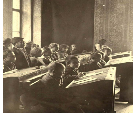
Fotoğraf 5 Rus Mültecilerin barınması için oluşturulan ahşap barakalar ve Tophane'deki Rus Okulu'nun bir sınıfı (Ar, 2019, s. 105-113).