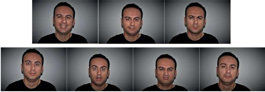
řekil 1. Evrensel Duygu İfadeleri 1