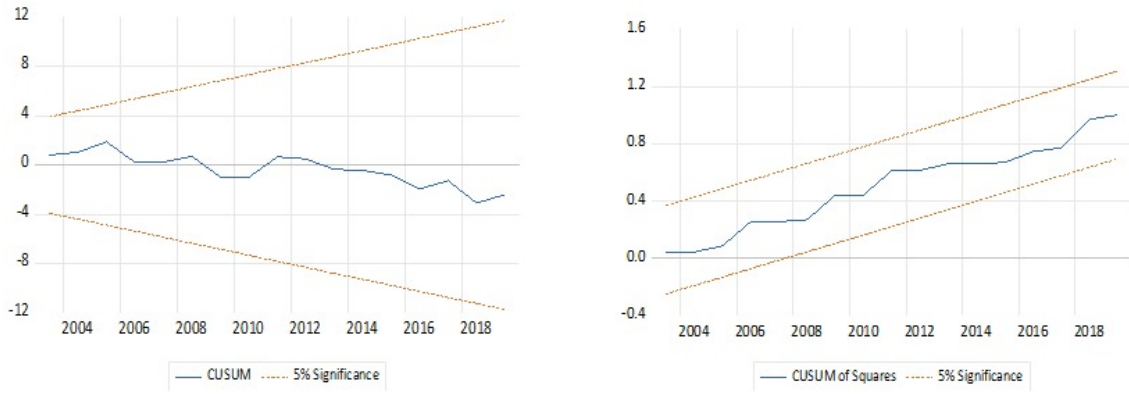
Şekil 2: CUSUM ve CUSUMQ Grafiği

Tanısal test sonuçlarına göre P değerinin 0.05'ten büyük olması dolayısıyla modelde değişen varyans, otokorelasyon sorunu ve spesifikasyon hatası olmadığı dolayısıyla modelin normal dağılım göstermiş olduğu sonucu elde edilmiştir. Tahmini yapılan değişkenlerin istikrarlılığının tespitinde kullanılan CUSUM ve CUSUMQ grafikleri ise Şekil 2 ile gösterilmektedir.