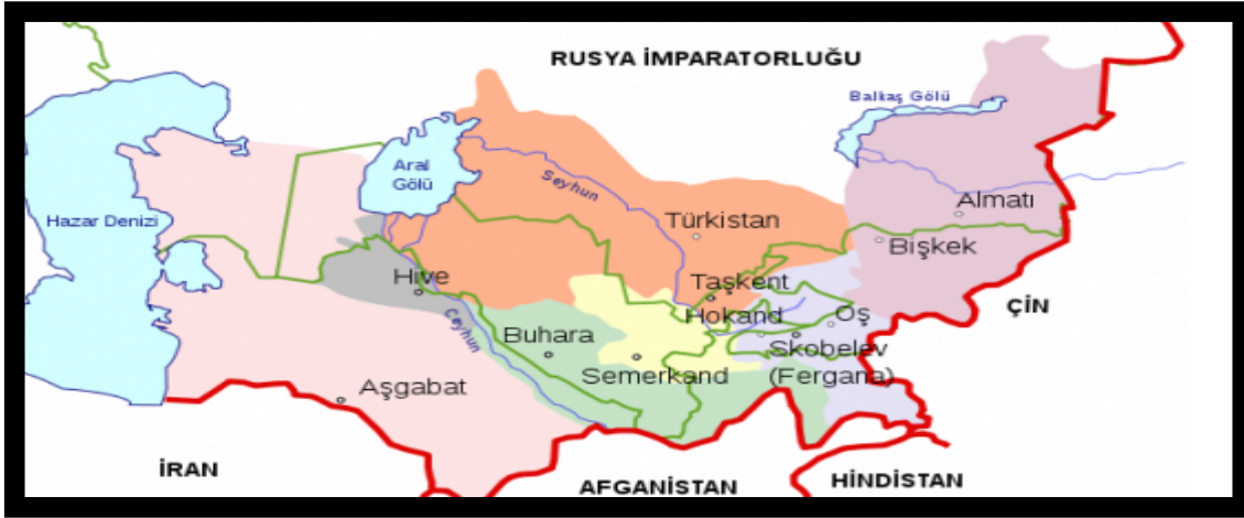
Harita 1: Türkistan Hanlıkları Haritası 2

İşgalin diğer bir bahanesi de sınırlardaki asayiş meselesi idi. Rusya Türkistan'da işgal ettiği bölgelere Türklerin geçişlerini ve saldırılarını sınır ihlali sayarak kaçak geçişleri önleme bahanesi ile Türkistan içlerinde yeni yerler işgal etti. Buralara kaleler kurarak da kalıcı oldu. (Çapraz, 2011: 58).