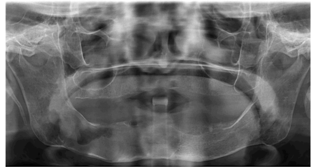
Şekil 1. Preoperatif panoramik görüntü. Sağ posterior mandibulada büyük boyutlu radyolüsent lezyon

Cerrahi müdahaleleri tamamlanmış ve en az 3 aylık rutin takipleri mevcut olan 16 OKK vakasının 3 tanesinde nüks gözlenmiştir. Nüks gözlenen 3 vakanın 1 tane-