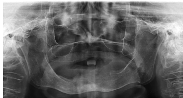
Şekil 3. Dekompresyon sonrası enükleasyon+küretaj uygulanan hastanın postoperatif 1. yıl panoramik görüntüsü