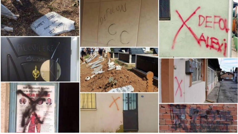
Fotođraf 1: 2012-2019 Yılları Arasında İşaretlenen Alevi Evleri ve Tahrir Edilen Mezarları