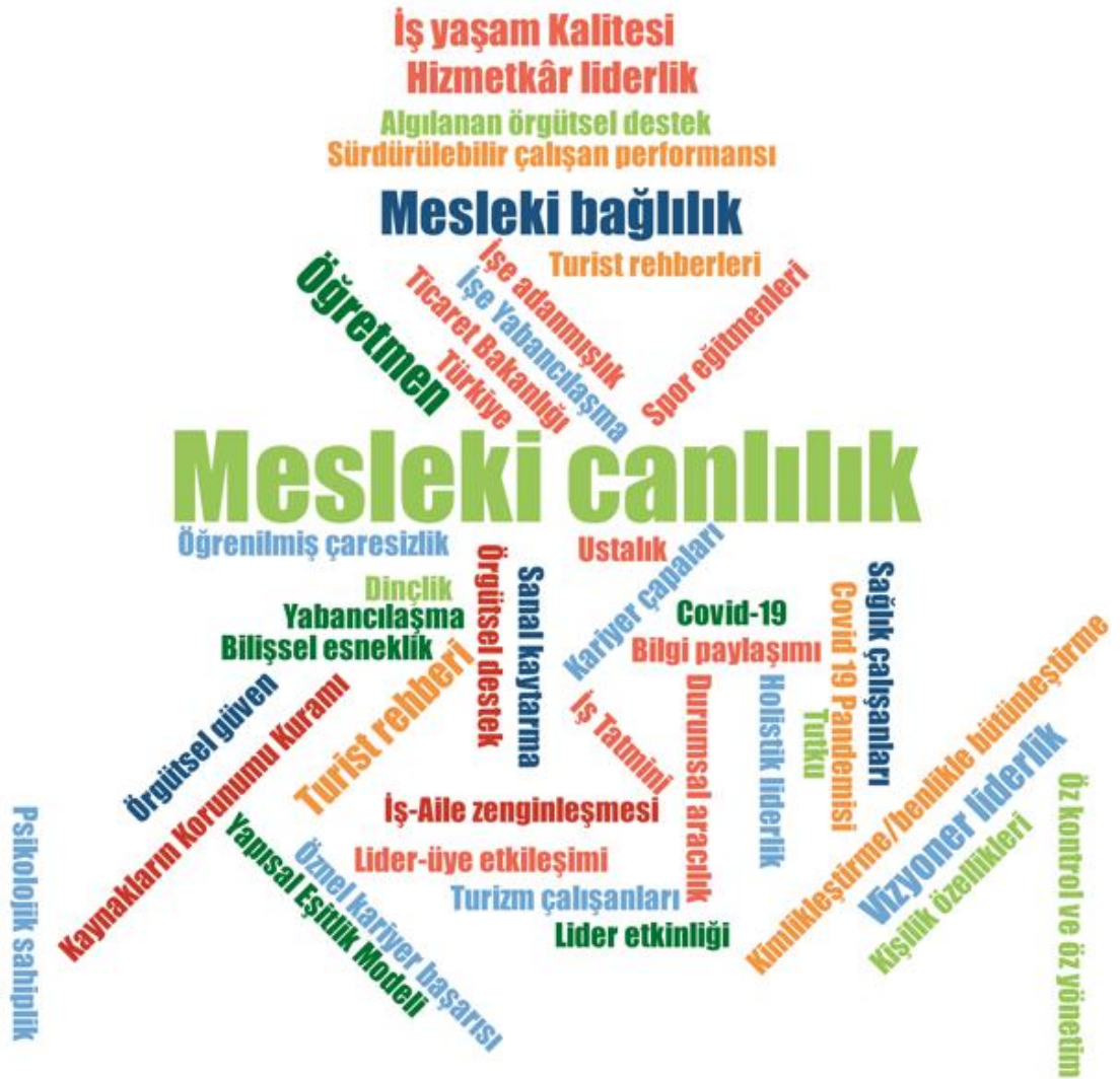
Şekil 2: Anahtar kelime frekansı

Mesleki canlılıkla ilgili çalışmaların anahtar kelime ve çalışmalarda kullanılan istatistiksel testler ve analizlere ait frekans dağılımları MAXQDA 2020 programı kullanılarak yapılmıştır. Çalışmaya dâhil edilen eserlerde bulunan kelime sayımı fonksiyonu ile ilkin anahtar kelimelere ait kelime sıklıkları belirlenmiş ve akabinde ortaya konulmuştur. Bu bağlamda en fazla tercih edilen anahtar kelimeler ortaya konulmuştur. Çalışmalarda kullanılan anahtar kelimelere ait frekans analizi aşağıda Şekil 2'de yer almaktadır.