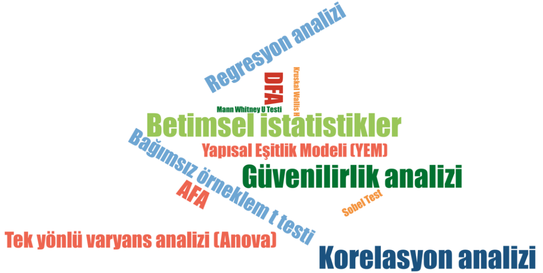
Şekil 3: Eserlerde kullanılan istatistiksel testler ve analizler

Çalışmalarda kullanılan belli başlı istatistiksel testler ve analizlere ait frekans analizi Şekil 3’ te gösterilmiştir.