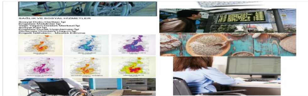
Resim 5. Konya Büyükşehir Belediyesi Engelli Hizmetleri Stratejik Öncelikleri

Plan vatandaş analizinde talepler arasında, “engelli vatandaşların engelsiz hayatları için yardım edilmesi” başlığı yer almaktadır (Konya Büyükşehir Belediyesi, t.y.: 63). Kamu Kurum ve Kuruluşları, Üniversiteler, STK, Dernek, Vakıfların Görüşleri’nin verildiği bölümde, hiçbir kuruluşun “engellilik” sorununa dair talep ya da yorumu bulunamamıştır (Konya Büyükşehir Belediyesi, t.y.: 65-68). Seydişehir İlçe Belediye Başkanlığı ise “Şehir içi ve köy otobüs seferlerinin iyileştirilmesi talebini (65 yaş üstü ve engelliler adına)” istemiştir (Konya Büyükşehir Belediyesi, t.y.: 69).