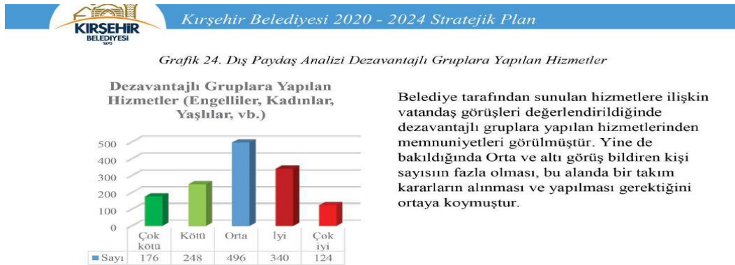
Resim 3. Kırşehir Belediyesi Dezavantajlı Grupların Planda Gösterimi

Kırşehir Belediye Başkanlığı Stratejik Planında engelliler konusu, “Dezavantajlı gruplar” arasında sayılmış, ancak bu grupta yaşlılar ve kadınlar gibi çok geniş bir kesim de dezavantajlı kabul edildiğinden somut bir ayırım yapmak mümkün olamamıştır. Bir bütün olarak “Dezavantajlı Gruplar” konusu ise “Dış Paydaş Analizi”nde ağırlıklı olarak “orta ve altı” olarak değerlendirildiğinden etkin bir hizmet yürütümü yansıtlamadığı görülmüştür (Kırşehir Belediyesi, t.y.: 94).