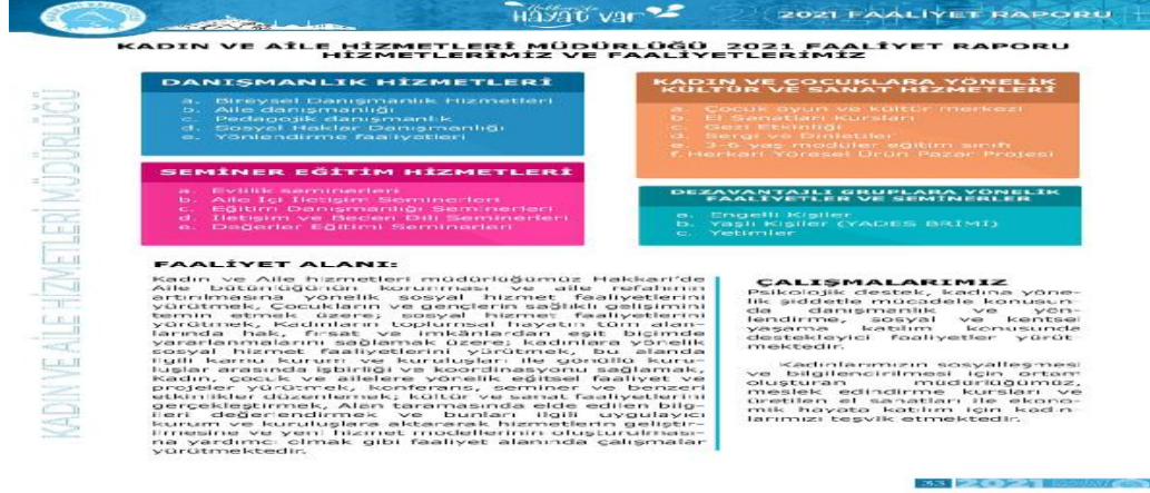
Resim 2. Hakkari Belediyesi Engelli Hizmetleri

Merkezi ve Akşam Sanat Okulu ile iş birliği içinde dezavantajlılar için eğitim programları düzenlendiği anlaşılmıştır (Hakkâri Belediyesi, t.y.: 33-34).