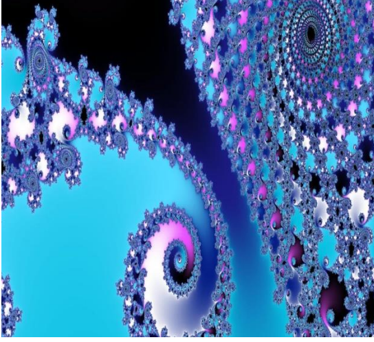
Şekil-3: Fraktal Sistemler (Anonim)

Bu kavramlar ve teknikler, kaos teorisinin fizikteki uygulamalarında sıklıkla kullanılan bazı temel araçlardır (Tsonis, 2019). Bu bakımdan denilebilir ki kaos teorisi, herhangi bir spesifik formül veya denklemle sınırlı tutulamaz. Bu nedenle, kaos teorisi, belirli bir sistemdeki karmaşık davranışları anlamak için farklı yaklaşımların ve matematiksel araçların birleşimini içerir (Strogatz, 2014).