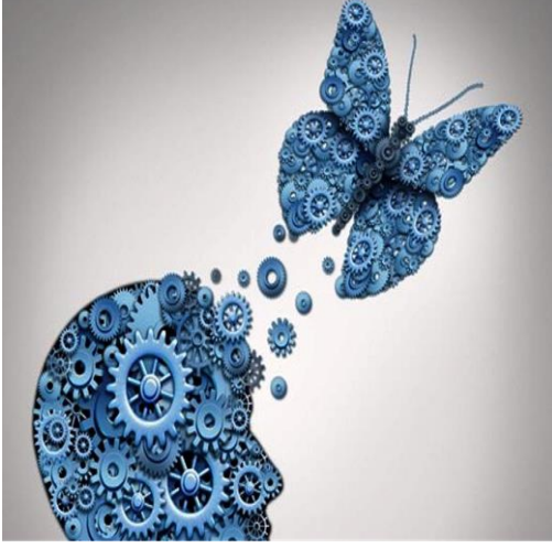
Şekil-1: Kelebek Etkisi (Anonim)

Atraktörler: Kaotik sistemler genellikle belirli bir duruma veya davranışa doğru hareket eden ve bu durumda kalan "atraktörler" olarak adlandırılan dinamik yapılarla karakterize edilir (Ott, 2002). Lorenz Atraktörünün görsel olarak tasviri Şekil-2’de gösterilmektedir.