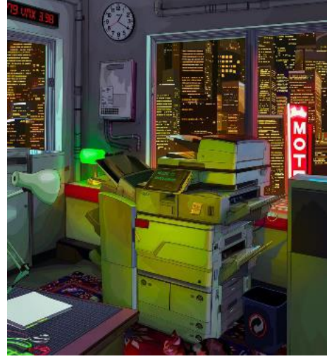
Şekil 3. NFT Örnek 2 (NFT Example 2) [36].