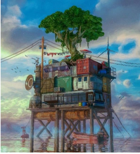
Şekil 2. NFT Örnek 1 (NFT Example 1) [35].