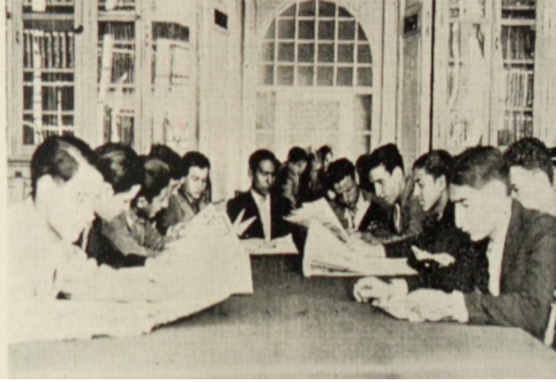
Resim 2: İzmir Halkevi kitapsarayına devam eden gençler.

mevcut kitapların sınıflandırması yapılmış, gelen bağışlar bu sınıflandırmaya taşınmış ve çıkarılması planlanan İzmir Halkevi Dergisi için girişimlerde bulunulmuştur. 78 Kütüphane dermesinin sınıflandırılması işlemlerinde İzmir Milli Kütüphanede kullanılan sınıflama yöntemi örnek alınmıştır. 79