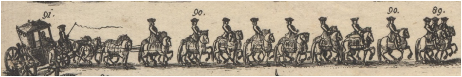
Görsel 35. 89- Üç kont uşağı. 90- Kont Wurmbrand'ın mirahuru ve altı koşumlu ve yedekli at. 91- Kont Wurmbrand'ın arabası ve iki haydut.