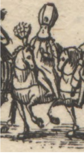
Görsel 26. Cânibî Ali Paşa'nın tasviri.

von Wurmbbrand, mareşal ve Saray Harp Şûrâsı mensubu, mihmandar; kayzerî çavuşbaşının arkasında at üstünde kayzerî saray tercümanı.