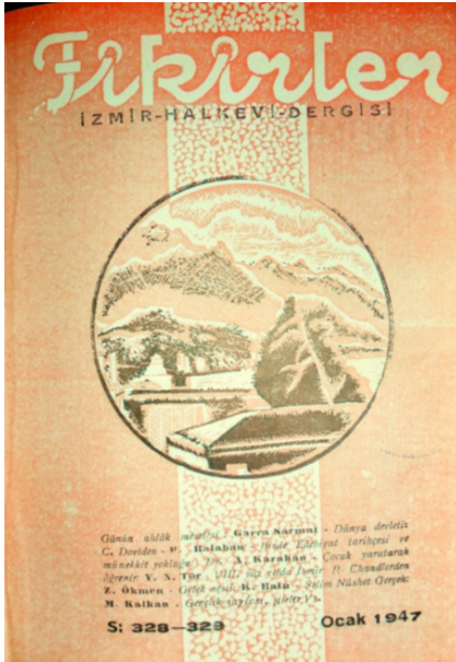
Resim 3: Fikirler dergisi kapak resmi.

İzmir Halkevinin kütüphane hizmetleri ve yayıncılık faaliyetleri hakkında tutulan son kayıtlardan birinin derlendiği 1949 yılında, kütüphanenin onlu sınıflama sistemine göre sınıflaması yapılan toplam 7.439 kitabı mevcuttur. En fazla 70-80 kişinin aynı anda kullanabildiği okuma salonu hemen her gün ve kütüphanenin açık olduğu her saatte yoğun bir biçimde kullanılan kütüphanenin yıllık kullanıcı sayısı da 8 bin sınırına ulaşmıştır. 105 Bu rakamlar ve kullanım yoğunluğu, İzmir Halkevi ve kütüphanesinin 1940'lı yıllarda kentün kültür ikliminin önemli besleyici kanallarından biri olduğunu, bu kütüphanenin Halkevlerinin kuruluş gayelerinin ötesinde bir sorumluluk ve anlayışla hizmetlerini sürdürdüğünü göstermektedir. Kütüphanenin eriştiği bilinirlik, kullanım yoğunluğu ve hizmet çeşitliliği, aynı zamanda halkın bu yöndeki taleplerinin yoğunluk düzeyinin bir yansımasıdır. Bu durum, kütüphanenin, bir bilgi merkezi için en önemli başarı ölçütlerinden biri olarak kabul edilen “kullanıcılarla bütünleşme” becerisini gösterebildiğini de ortaya koymaktadır.