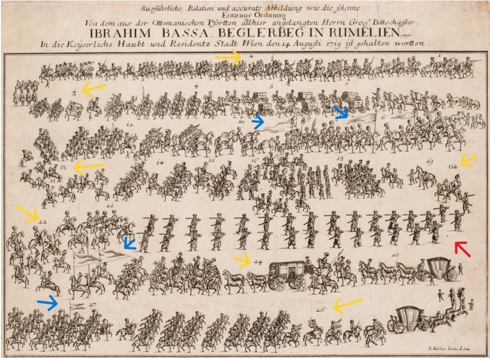
Görsel 3. Silahdar İbrahim Paşa’nın 1719’da Viyana’ya Alayla Girişi ( Wien Museum, Inv.-Nr. 41207 )

eser de bırakamamıştır. 18 Hâl böyle olsa da, bu az sayıdaki eserlerden birisi, Osmanlı diplomasi tarihiyle yakından alakalı bir çalışmaya tesadüf etmiş ve bizim de kendisini zikretmemize vesile olmuştur. Silahdar İbrahim Paşa hakkında 50 x 39,5 cm ebatlarında, yine numaralandırılmış heyet mensupları (sarı okla gösterilmiştir) ve – hacim bakımından geniş yer tutacak olması ve makalenin asıl odağında olmamasından ötürü bu kısma yer vermediğimiz – ilgili açıklamalara sahip bu gravürün başlığı şu şekildedir: “Bâbiâli’den Buraya İntikal Etmiş Olan Sayın Büyük Elçi Rumeli Beylerbeyi İbrahim Paşa’nın Kayzerî Baş- ve İkamet Şehri Viyana’ya 14 Ağustos 1719’da Duhul Eden Tören Alayının Detaylı Açıklamaları ve Sahih Tasviri.” 19