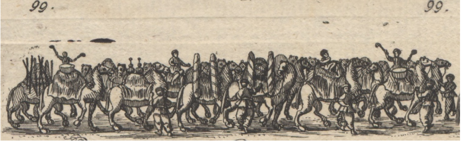
Görsel 39. 99- Develer ve deve üstünde iki köszen.