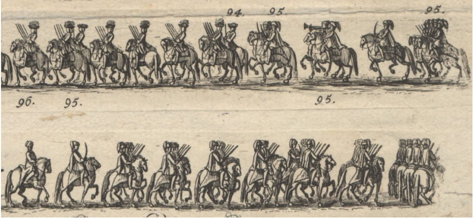
Görsel 37. 95- Bir Raablı husar bölüğü. 96- Bir Türk subayı.