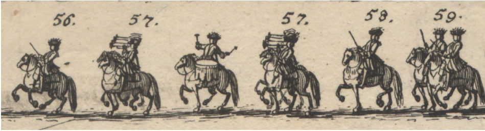
Görsel 21. 56- Yardımcı Schlegelhoffler. 57- Arkalarında sekiz tompetçi ve ortalarında köşen. 58- Kayzerî saracbaşı Wuhrrer. 59- İki teğmen Hölzel ve Dicker.