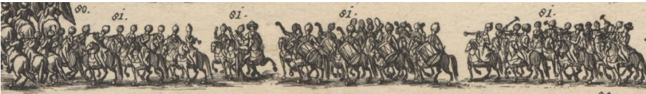
Görsel 31. 81- Peşlerinde Türk mehter takımı.