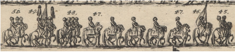
Görsel 19. 45- At sırtında iki Türk elçilik subayı; Selâm Ağası veya teşrifatçı ve bunun arkasından kapıcıbaşı. 46- Müteakiben sarı renkte bayrağı ile bayraktar veya bayrak taşıyıcısı geldi. 47- Yine beş Türk sarac ve bir o kadar yedek at. 48- At sırtında dört Türk subayı. 49- İki tuğlu bayraklar. 50- Daha fazla alt rütbeli Türk hizmetli yan yana.