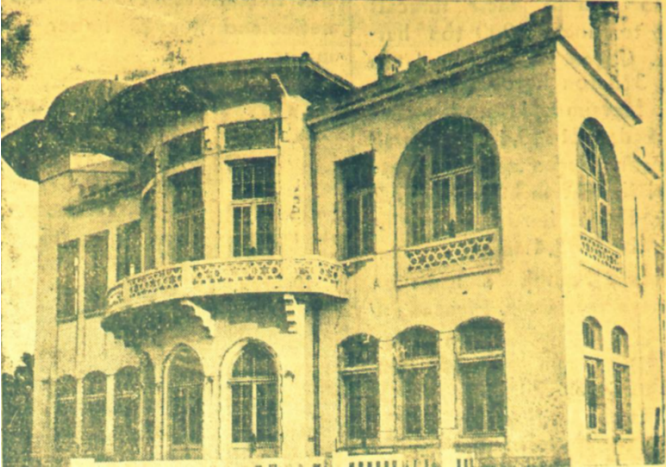
Resim 1: İzmir Halkevi Binası.

İzmir Türk Ocağı binası, resmi bir karar olmamasına karşın, 1931 Eylül ayından itibaren, İzmir halkı tarafından Halkevi olarak adlandırılmaya başlanır. Buna karşın, Halkevinin açılışına yönelik asıl planlı programlı çaba, CHP'nin yürüttüğü Halkevleri teşkilatına ilişkin çalışmaların tamamlanmasıyla başlar. 57 İzmir'in, Türkiye'nin farklı 14 kentinde açılışı yapılacak ilk Halkevlerinden birine ev sahipliği yapacağı bilgisi ise ilk kez 20 Ocak 1932 tarihinde kamuoyuna duyurulur. 58 8 Şubat 1932'den itibaren basında Türkiye genelinde Halkevlerinin açılacağı, ilk Halkevlerinden birinin de " İzmir Halkevi " adıyla İzmir'de olacağı haberi daha sık yer almaya başlar. 59 İzmir ili sınırları içinde açılan 22 Halkevinin 60 ilki olan İzmir Halkevi, resmi olarak açılışının yapıldığı 19 Şubat 1932 tarihinden itibaren, Halkevleri Talimatnamesi'nde belirtilen hemen her alanda yaptığı çalışmalar ve etkinliklerle, kentteki diğer Halkevlerinden ayrı bir noktada durur. 61 Çünkü İzmir ili sınırlarında açılan diğer Halkevlerinin İzmir Halkevindekine benzer bir yoğunluk ve çeşitlilikte hizmet sunumu hiç olmamıştır.