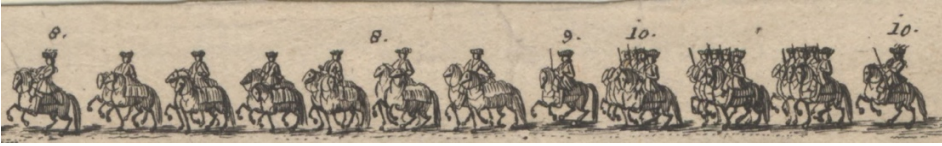
Görsel 8. 8- Kayzerî mirahur Antoni Raner ve altı koşumlu ve yedekli at. 32 9- Yardımcı Nicolaus Probst. 10- Kösleri örtmesi için bir onbaşı Karabinier mangası, sonunda bir onbaşı.