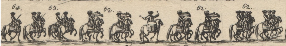
Görsel 23. 62- Müteakiben on iki kayzerî trompetçi ve köszen, bunların önünde ise at süren yirmi iki kayzerî saraç. 63- Arkalarından dört çift Alman beyazı. 64- Bir Türk subayı.