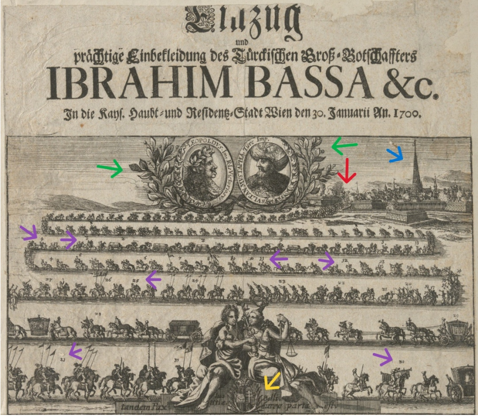
Görsel 1. İbrahim Paşa'nın 1700'de Viyana'ya Alayla Girişi (Wien Museum, Inv.-Nr. 198952)

yayımcısı ve satıcısı Adam Jonathan Felsecker'in (9 Nisan 1683-10 Mayıs 1729) 10 imzasını taşımaktadır. 1700 yılına tarihlenmiş olan gravür Nürnberg'de basılmış olup 38 x 30,3 cm ebatlarındadır ve Türkçesiyle "Türk Büyük Elçisi İbrahim Paşa ve Maiyetinin Şehre Girişi ve Bunu Görkemli Bir Şekilde İfası" 11 başlığına sahiptir (Görsel 1). 12