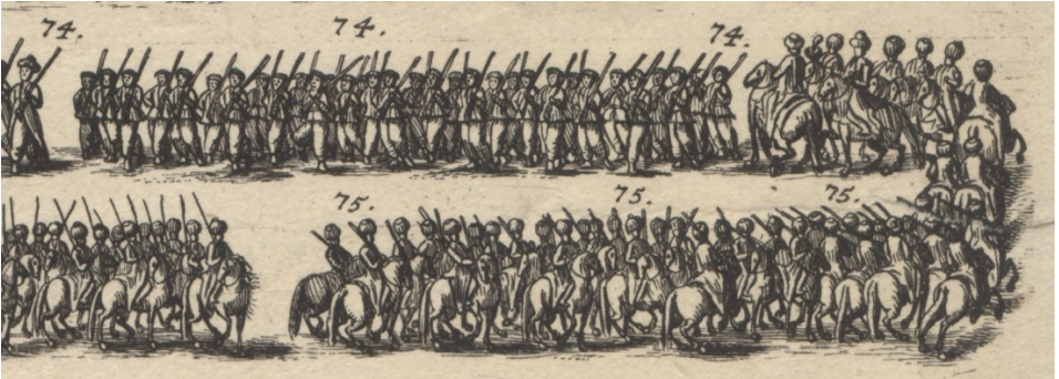
Görsel 28. 74- Müteakiben subaylarıyla birlikte yeniçeriler geldi. 75- Filinta (Flinte) tüfekleriyle Türkler.