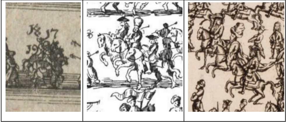
Görsel 4. Gravürlerde Osmanlı Büyük Elçileri (solda 1700, ortada 1702, sağda 1719)

Bir sonraki gravüre geçmeden evvel, İbrahim paşaların nasıl tasvir edildiğine yakından bakalım, zira gravürler arasındaki belki de en büyük fark, kendisini özellikle detayda göstermektedir. Bu sayede gravür işçiliğinin İbrahim Paşa için 1700 ve 1702, Silahdar İbrahim Paşa içinse 1719 yılında nasıl bir gelişme kaydettiği daha net anlaşılabilir. Büyük elçi tasvirleri yan yana getirildiğinde ortaya şu şekilde bir sonuç çıkmaktadır: