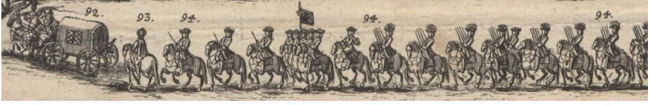
Görsel 36. 92- Üç beygirli çifte koşulu bir Türk arabası. 93- Bir Türk subayı. 94- Mütakiben Dragoner von Althan bölüğünden dört birlik; not: gravürde yer darlığı dolayısıyla bir birlikten fazlası gösterilemedi.