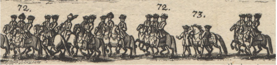
Görsel 27. 72- Arkalarında at sırtında hem kayzerî hem de Türk sâkiler (Mundschenk). 73- Kayzerî saray at çekildi.