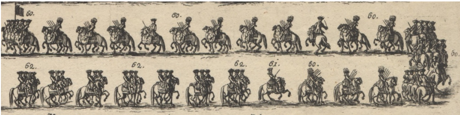
Görsel 22. 60- At sırtında on altı birimden mürekkep diğer bölük, başlarında hem 1719'da hem de 1740'ta bayraktarlık yapan Onbaşı Heimerl, her dördüncü birimde bir onbaşı bulunuyordu. 61- Bu bölüğü muhafız âmiri Geramb tamamladı. 62- Müteakiben on iki kayzerî trompetçi ve köşen, bunların önünde ise at süren yirmi iki kayzerî sarac.