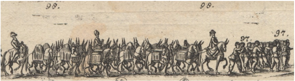
Görsel 38. 97- Arkalarında on dört Türk hokkabaz. 98- Katırlar.