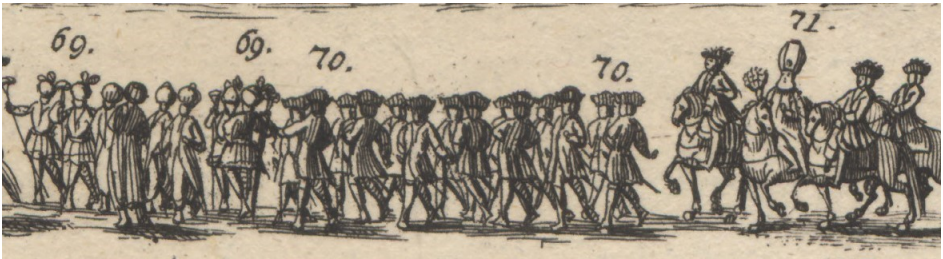
Görsel 25. 69- Ekselansları Türk büyük elçiye ait dört şatır, veya yaya; sağ tarafta Prens Augsburg (aslında Prens [Heinrich von] Auersperg), sol tarafta General Wurmbbrand'ın ikişer piyadesi. 70- Arkalarında Prens Augsburg ve General Wurmbbrand'ın ön dört uşağı. 71- Ekselansları Türk Büyük Elçisi Cânibî Ali Paşa'nın bizzat kendisi, başında büyük kallâvî kavuğu, at sürerken, elinde ak balıkçıl kuşunun tüyünden yapılmış yelpaze; sağında at sırtında kayzerî majestelerinin kayzerî çavuşbaşısı ( Obristhofmarschall ) ekselansları Heinrich Prens von Augsburg ve solunda ekselansları Heinrich Casamir Kont