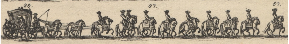
Görsel 34. 87- Altı koşumlu ve yedekli atı olduğu hâlde Prens Augsburg'ın mirahuru. 88- Prens Augsburg'ın arabası ve iki haydut (Macar paralı asker, Alm. Heiduck ).