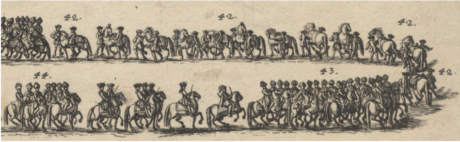
Görsel 18. 42- İki Alman köylü tarafından çekilen on iki eyersiz Türk hediye at. 43- Ayrıca at sırtında on sekiz Türk kapıcı. 44- Yine at üstünde yedi çuhadar veya kapı halkı geldi.