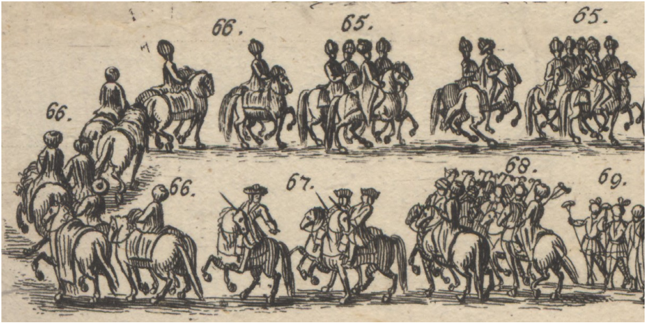
Görsel 24. 65- Yine at üstünde dokuz Türk çuhadar, veya hizmetli, iki üst subay. 66- Türk büyük elçinin, beş Türk saraç tarafından çekilen beş koşumlu ve yedekli at. 67- Kayzerî saray konakçibaşısı albayı ve iki saray kuryesi. 68- Müteakiben sekiz Türk deli çavuş.