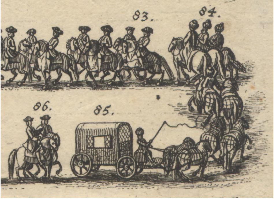
32 Görsel 33. 84- Yine üç Türk hizmetlisi. 85- Elçinin altı koşumlu ve yedekli tören arabası. 86- İki prens uşağı.