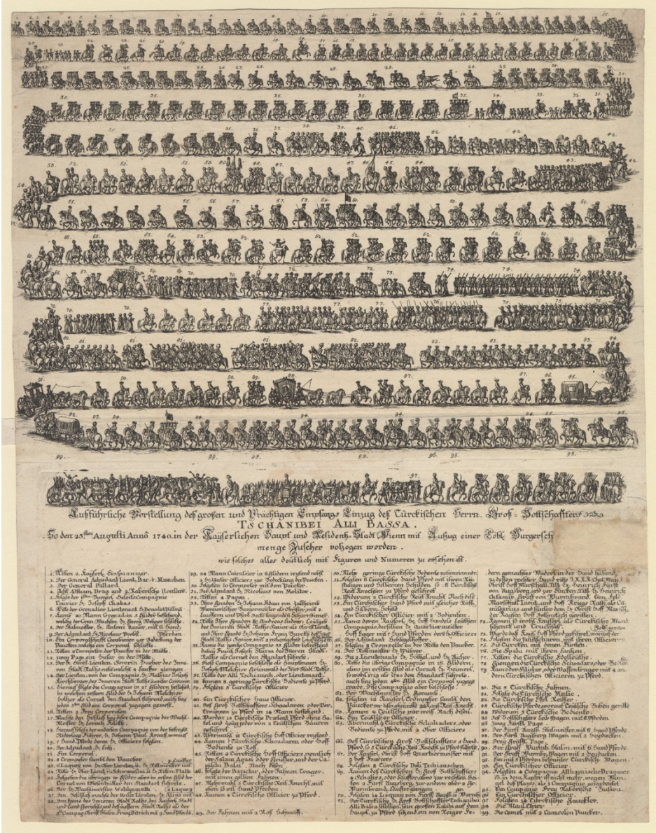
Görsel 5. Cânibi Ali Paşa'nın 1740'ta Viyana'ya Alayla Girişi

99 zümre ve 14 sıra hâlinde gösterilen Cânibi Ali Paşa'nın 23 Ağustos 1740'taki şehre giriş alayı gravürü, önceki örneklerinden ziyadesiyle kapsamlı ve ayrıntılıdır. Baeck'in mükemmel bir iş çıkardığı, aşağıda tüm zümreler gruplar