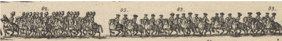
Görsel 32. 82- Türk katırcılar [metinde sehven eşek deniyor] (harbende-i miriye). 83- Alman oğlanların sürdüğü Türk atları.