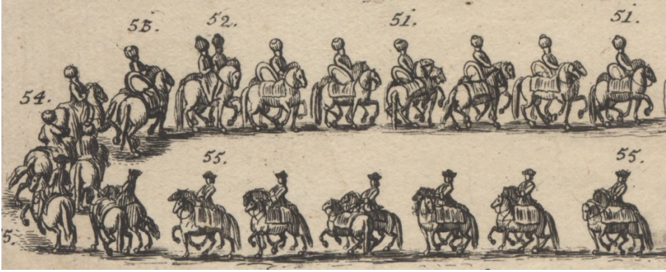
Görsel 20. 51- Arkalarında tam koşumlu ve gümüş kalkanlı altı koşumlu ve yedekli Türk atı. 52- Bunların arkasında iki Türk sarac. 53- Bir yedek Türk atı, yine koşumlu ve gümüş kalkanlı. 54- İki hizmetlisiyle bir Türk subayı. 55- Müteakiben kayzerî saray tüccarları bölüğü ve kayzerî konakçıbaşı Hoffegger, yedi koşumlu ve yedekli at ve subayları.