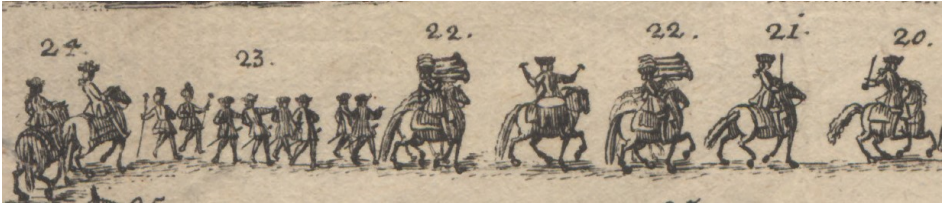
Görsel 12. 20- [Krauß'un ]Yardımcısı Lutz. 21- Bir onbaşı. 22- Sekiz trompetçi ve bir köşzen. 23- Yarbayın ve süvari komutanının altı uşağı ve iki piyadesi. 24- At sırtında Yarbay von Schwanesini ve süvari komutanı Flalk.