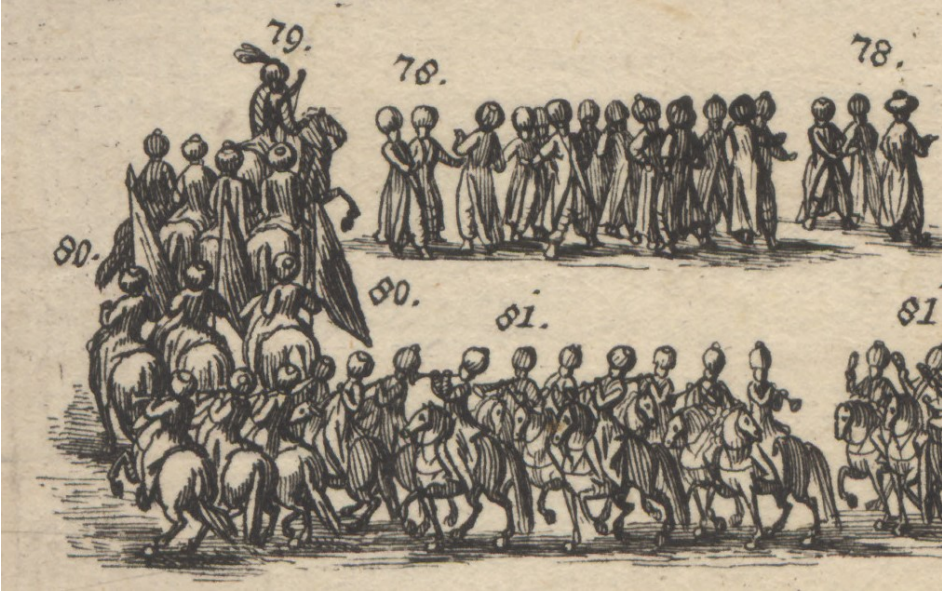
Görsel 30. 78- Müteakiben Türk çuhadarlar veya hizmetliler. 79- Arkalarında silahdar veya silah taşıyan, at üstünde dört başka Türk subayı. 80- Üç Türk bayrağı.