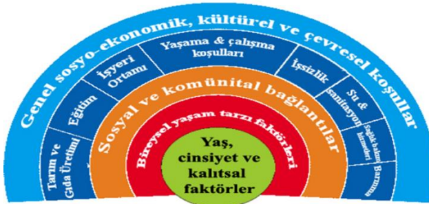
Şekil 1: Whitehead, M., & Dahlgren, G. (1991)

Bu doğrultuda bu çalışmada SSB; sosyoekonomik belirleyiciler, çevresel belirleyiciler, kişisel belirleyiciler (sağlık davranışları) başlıkları açısından incelenecektir.