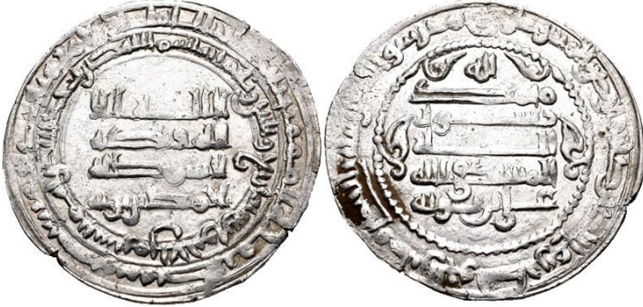
Foto 2: Muizzüddeve Dönemi, Dirhem, Darb Yeri: Tüster, Yıl: 945, Çap: 28mm, Ağırlık: 4.20gr., https://www.acsearch.info/search.html?id=3331745 Erişim Tarihi 27.3.2024

Ahmed b. Büveyh'in Ahvâz'da bastırıldığı dirhemnin düzeni de Tüster darblı dirheminin bir benzeridir. Ön yüzünde “ Lâ ilâhe illâ Allah vahdehu lâ şerike leh Ahmed bin Büveyh ”, çevresinde “ Bismillâh duribe haza'd-dirhem el-Ahvâz sene 333 ”, arka yüzünde “ Lillah Muhammedun Resulallah el-Müstekfi-Billâh Ali bin Büveyh ” çevresinde ise “ Muhammedun Resulallah erselehu bi'l-huda ve dîni'l-hakk liyüzhirahu aleddîni küllih. Velev kerihe'l-müşrikûn ” yazmaktadır. İmâdüddeve ve Muizzüddeve'nin bastırıldığı bu sikkelerin halîfe tarafından kendilerine verilen lakapları olmadan yazılmış olması, onların Ahmed b. Büveyh'in Bağdat'a girmesinden önce basıldığını göstermektedir. Ancak halîfenin isminin de sikkeye darb edilmiş olması, onların bu esnada halîfeye bağlı olduklarını ortaya koymaktadır (Bates, 1996, s. 7; Mahmud, 1999, s. 332; Poole, 1876, s. 194) (Fotoğraf 2).