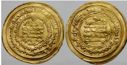
Foto4: Müeyyidüddevlle Dönemi, Altın Dinar, Darb Yeri: Muhammediyye, Yıl: 976/977, Ağırlık: 4.10gr.