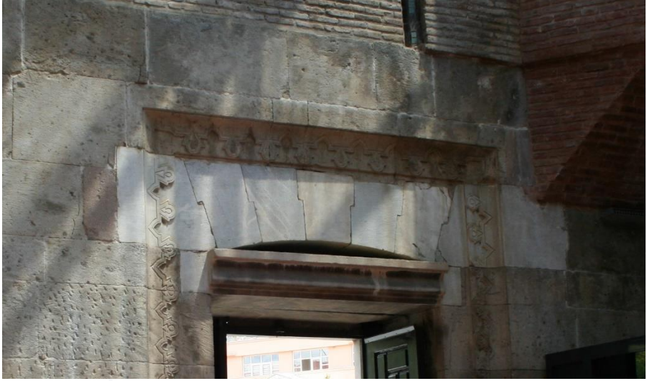
Foto 3: Karatay Medresesi Taçkapısı- Arka Yüzdeki Çerçevenin Tezminatı