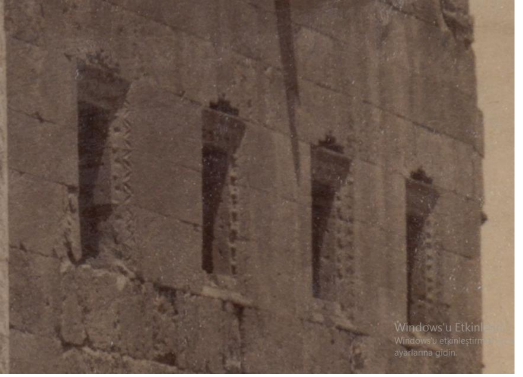
Foto 7: Karatay Medresesi Doğu Cephesindeki Pencereleler (J.H.Haynes-1884)