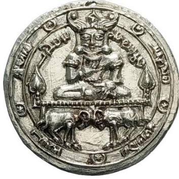
Foto 7: Adudüddeve Dönemi, Gümüş Madalyon, Darb Yeri: Fars, Çap: 60.7mm, Ağırlık: 34.47gr., https://www.acsearch.info/search.html?id=10848109 Erişim Tarihi 27.3.2024

Emîr Ebu Nasr Fîrûz Hârşâz, kardeşi Şerefüddeve b. Adudüddeve'nin vefatı üzerine 22 Ağustos 989 (379) tarihinde Tâi'-Lillâh'ın huzurunda yapılan tayin merasiminde diğer hükümdarlık alametleri ile birlikte Bahâüddeve ve Ziyâülmille lakaplarını almıştı. Gıyâsülümme de onun lakapları arasındaydı (Birûnî, 2011, s. 167-168; İbn Kesîr, 1995, s. 519; Nüveyrî, 1975-1985, C. 26, s. 235; Sâbî, 1986, s. 131-133; Gümüş, 2019, s. 154; Siddiqi, 1934, s. 40). Bahâüddeve'nin Halîfe Tâi'-Lillâh'ı azlederek yerine Kadir Billâh'a biat etmesinin 5 ardından basılan sikkelerde yeni halîfenin adı ve emîrin söz konusu lakapları geçmektedir. 1007 (398) yılında basılan sikkenin ön yüzünde “ Lâ ilâhe illâllah vahdehu lâ şerîke leh el-Melik Bahâüddeve ve Ziyâülmille ve Gıyâsülümme el-Mulûk ”, çevresinde “ Bismillâh duribe haza'd-dînar bi Medineti's-Selâm sene 397 ”, dış kuşağında Rûm suresi 4. ve 5. ayetler yer almaktadır. Arka yüzünde ise “ Lillah Muhammedun Resulullah sellallahu aleyhi ve sellem el-Kadir-Billâh Şâhanşâh Kıvâmüddin Ebu Nasr İbrîz ”, çevresinde ise “ Lillah Muhammedun Resulullah. Erselehu bi'l-huda ve dîni'l-hakk liyüzhirahu aleddîni küllih. Velev kerihel-müşrikûn ” yazmaktadır (Abbott, 1939, s. 362; Artuk & Artuk, 1970, s. 338-339; Mahmud, 1999, s. 344-348; Poole, 1876, s. 213-217) (Fotoğraf 8). Burada Emîr Bahâüddeve'nin de sikkelerinde -babası Adudüddeve gibi- Şâhanşâh ünvanını kullandığı görülmektedir (Poole, 1876, s. 216).