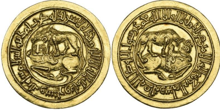
Foto6: Bahtiyâr Dönemi, Altın Madalyon, Darb Yeri: Medînetü's-Selâm, Yıl: 973/974, Çap: 38mm, Ağırlık: 20.54gr., https://www.numisbids.com/n.php?p=lot&sid=3133&lot=118 Erişim Tarihi 17.4.2024

973-974 (363) yılında Bağdat'ta basılmış Emîr Bahtiyâr dönemine ait dikkate değer iki figürlü sikke daha bilinmektedir. Yırtıcı hayvanların av sahnelerine yer verilmiş olan bu sikkelerden birinin her iki tarafta da bir geyiğe ya da dağ keçisine saldıran aslan yer almaktadır (Fotoğraf 6). Sikkenin ön yüzünde kelime-i tevhid ile darb tarihi ve yeri bulunurken arka yüzünde İzzüddeve künyesi bulunmaktadır. Hayvan figürlerinin yer aldığı diğer sikkede ise bir tarafta ördeği yakalayan bir kartal, diğer tarafında ise ceylan yutan bir kartal tasvir edilmektedir (Miles, 1964, s. 288, 295-296; Miles, 2007, s. 375-376).