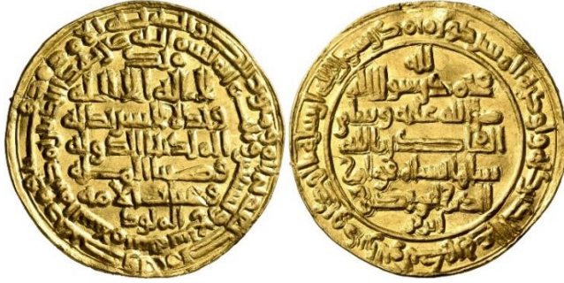
Foto 8: Bahâüddeve Dönemi, Altın Dinar, Darb Yeri: Medînetü's-Selâm, Yıl: 1006/1007, Çap: 26mm, Ağırlık: 4.50gr., https://www.acsearch.info/search.html?id=12229007 Erişim Tarihi 27.3.2024