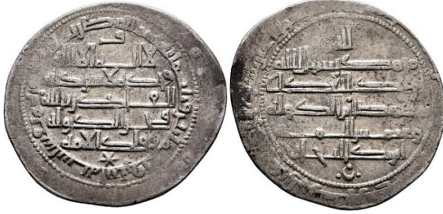
Foto 9: Fahrüddeve Dönemi, Gümüş Dirhem, Darb Yeri: Fesa, Yıl: 992/993, Çap: 27mm, Ağırlık: 4.65gr. https://www.acsearch.info/search.html?id=12010687 Erişim Tarihi 27.3.2024