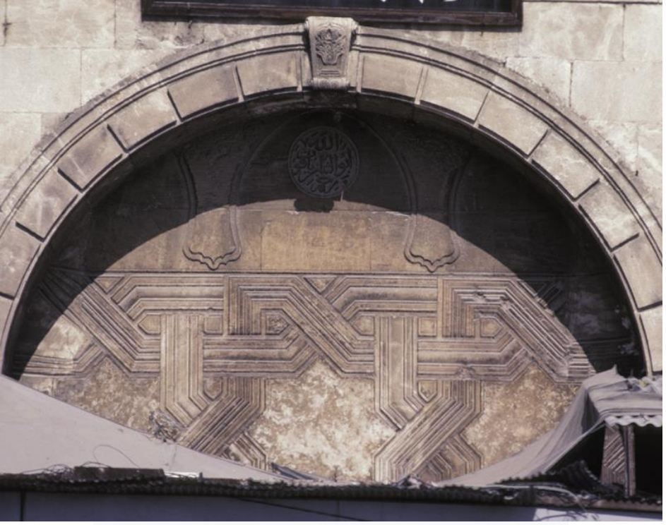
Foto 13: Halep- El-Şerefiye Medresesi Taçkapısı (T. Allen, Fig.33)