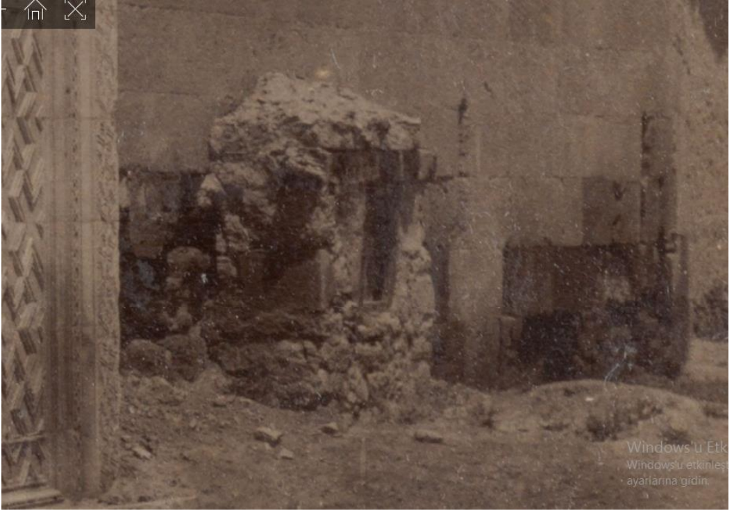
Foto 8: Karatay Medresesi Doğu Cephesi- Kalıntı (J.H.Haynes-1884)