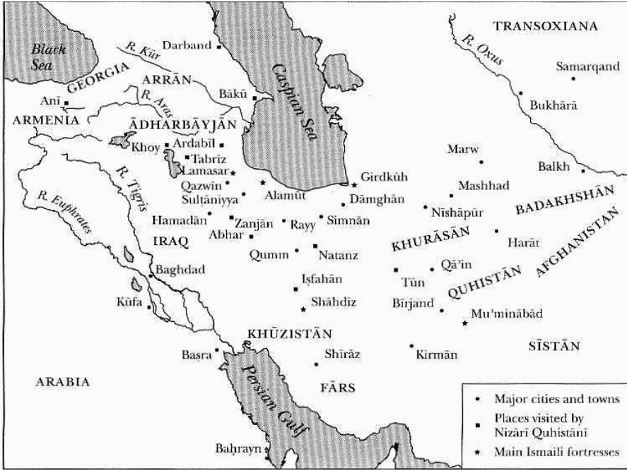
Harita 1: XIII. Yüzyıl'da İran ve Azerbaycan (Nadia Eboo Jamal, Surviving the Mongols: Nizari Quhistani and Continuity of Ismaili Tradition in Persia , The Institute of Ismaili Studies, London & New York 2002'den alınmıştır.)