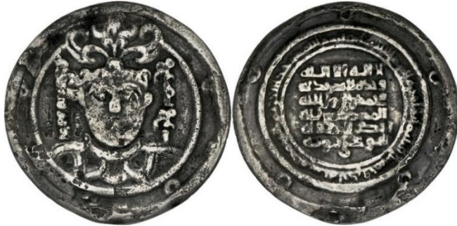
Foto 5: Rüknüddeve Dönemi, Gümüş Dirhem, Darb Yeri: Muhammediyye, Yıl: 962, Çap: 41.2mm, Ağırlık:12.90gr., https://www.acsearch.info/search.html?id=11651492 Erişim Tarihi 27.3.2024