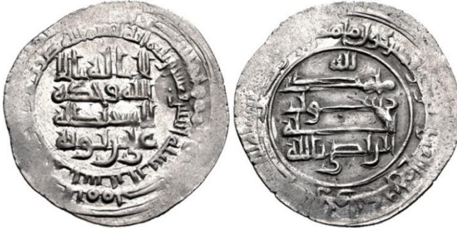
Foto 1: İmâdüddeve Dönemi, Dirhem, Darb Yeri: Şîraz, Yıl: 933/934, Çap: 27mm, Ağırlık: 3.05gr., https://www.acsearch.info/search.html?id=4631697 Erişim Tarihi 27.3.2024