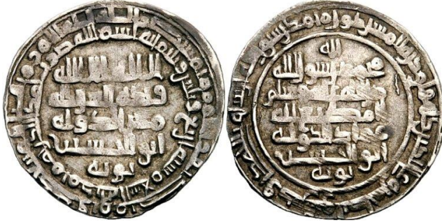
Foto 3: Muizzüddeve Dönemi, Dirhem, Darb Yeri: Medîneti's-Selâm, Yıl: 945-946, Ağırlık: 2.77gr., https://www.acsearch.info/search.html?id=1243632 Erişim Tarihi 27.3.2024

Halife Mutî-Lillâh emriyle bu dönemde bastırılan dirhemın ön yüzünde “ Lâ ilâhe illâ Allah vahdehu lâ şerîke leh Muizzüddeve Ebu'l-Hüseyn Büveyh ”, çevresinde “ Bismillâh duribe haza'd-dirhem bi Medineti's-Selâm sene 334 ” lejandı, dış kuşağında Rûm suresi 4. ve 5. ayetler yer almaktadır. Arka yüzünde “ Lillah Muhammedun Resulallah Sallallahu Aleyhi vessellem el-Mutî-Lillâh İmâdüddeve Ebu'l-Hasan Büveyh ”, çevresinde ise “ Muhammeden Resulallah. Erselehu bi'l-huda ve dîni'l-hakk liyüzhirahu aleddîni küllih. Velev kerihe'l-müşrikân ” yazmaktadır (Fotoğraf 3).