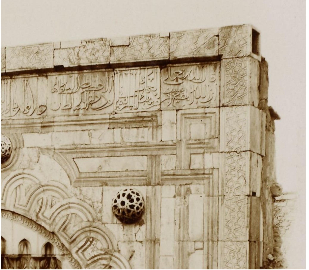
Foto 6: Karatay Medresesi Taçkapısı'ndan Köşetaşı Detayı