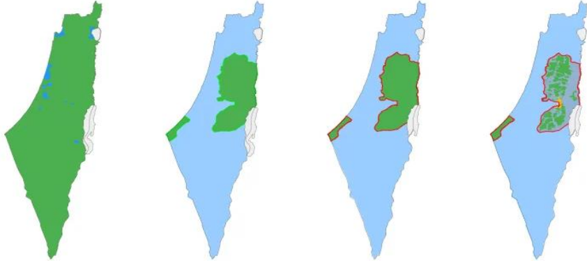
Harita 1: İsrail-Filistin çatışması: Harita ve grafiklerle kısa bir tarihçe (Al-Jazeera, 2023).

Bu noktaya dikkat kestiğimizde, ABD'li General Philip Henry Sheridan'ın (1831-1888) “En iyi Kızılderili, Ölü kızılderilidir” (İstanbul Üniversitesi, 2022) ifadesinin de temelde sömürgeciliğin demografik olarak çoğunlukta olma kaygısıyla ilişkisini gösterir. Bu tür bir sömürge için -bölgede kökten değişikliğe gittiğinden/ gitmeyi hedeflediğinden- klasik sömürgecilikten daha yıkıcı olduğu söylenebilir.