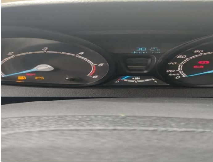
Resim 1: Aracın boş yakıt göstergesi.