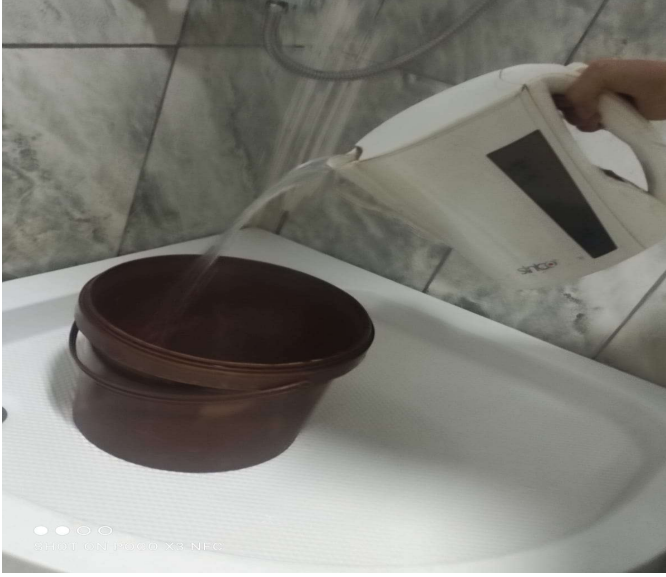
Resim 5. Dolmayan su kovası.

Yurdun kısıtlı imkanlarından dolayı sınırlı sıcak su olması suyun bazen çamurlu olması yeterli kadar hijyenik olmaması benim için bir yoksulluk, yeterli imkânım olsaydı daha iyi bir yurda ya da eve geçebilirdim. Özellikle eğitim aldığım şehir kışı çok sert geçirmekte, ketil ile su ısıtmak çok daha zor oluyor. Bu şekilde daha ne kadar devam edebilirim gerçekten bilmiyorum. Bu zorluklar beni her geçen gün daha fazla zorluyor. (Zeliha)