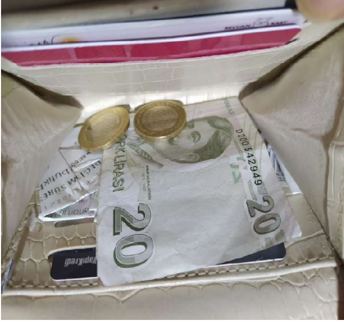
Resim 2. Boş Cüzdan

Öğrencisindir ve ay sonu gelmiştir. Çıkan ekonomik krizler, yaşanan enflasyonlar yapılan zamlar... insanlar yoksullukla mücadele etmekte. Kimi part time olarak fazla saat çalışarak kendi aile ekonomik seviyesini yükseltmekte Kimi kıt kanaat geçinmekte. Bazıları ise göç etmekte çözümü bulmuştur. Standart bir ailede yaşayan öğrencinin aylık geliri ona yetmemekte ay sonunu nasıl getireceğini düşünmekte. (Duygu)