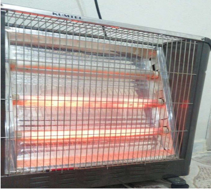
Resim 10. Katalitik soba

Hayatta birçok sıkıntı yaşayan insanların birde evlerinde sıkıntısı olduğunu düşünelim? Onca yokluğun ve sıkıntının üzerine birtakım eklenen sıkıntılar. Aşılamayacak sorunlar, yok edilemeyecek sıkıntılar. Bu soba bana evinde ısınma sorunu yaşayan insanları andırıyor. Bir aile, kalabalık ortam hızla artan sorunlar. Her şeyden şikayetçi olan, yoksulluğu kabul etmeyen yeni yetme çocuklar, bunalan aileler, depresyona giren babalar, dert sahibi olan anneler. Hepsinin ortak sorunu ise yoksulluk, sınıf ayrımları ve yaşam şartları. (Özgür)