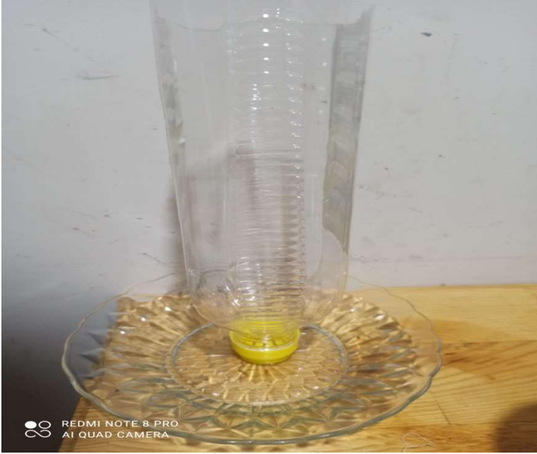
Resim 8. Ters çevrilmiş boş yağ şişesi