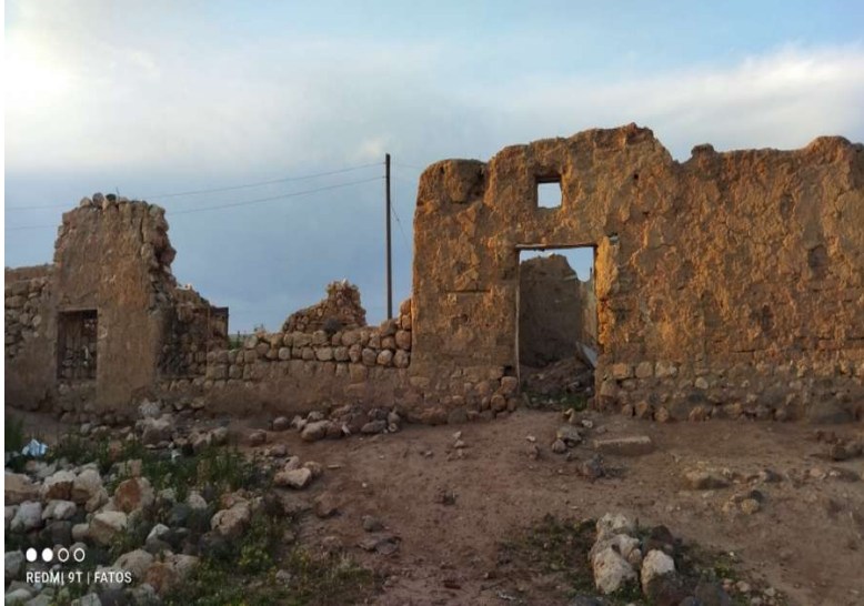
Resim 11. Kerpiç evler.

Bana yoksulluğu anlatan önemli şeylerden biri kerpiç evler. İçinde yaşamla mücadele eden insanlar, karanlıkta mum ışığında ders çalışmaya çalışan çocuklar, etrafta dört dönen anneler. Başımızda bize destek çıkacak bir babamız olmasa hayatımız nasıl olurdu? Derdimizi anlatabilecek, sırtımızı yaslayacak dağ gibi bir babamız olmazsa hayat nasıl olurdu. Aslında cevabı basit. Yoksul, yetim, öksüz ve kimsesiz. Aslında kerpiç evler, babası olmayan aile gibidir. Kerpiç evlerin çatısı yoktur tıpkı babası olmayan aileler gibi. (Fatma)