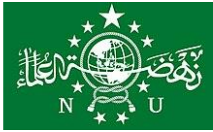
Figure 1. NU's Emblem

In the 1930s, Nahdlatul Ulama underwent significant expansion, emerging as one of Indonesia's two major religious organizations and movements prior to World War II. This period saw a rise in the organization's economic endeavors, with cooperative initiatives established in its branches to oversee donated lands and product sales. Rooted in traditional religious education, specifically the "pesantren" (Islamic boarding schools), the organization's foundation played a crucial role in its societal empowerment and growth both qualitatively and quantitatively. Initially concentrated in Java, the organization later expanded to the Kalimantan region, incorporating smaller structures and local organizations into its fold as it grew (Göksoy, 2006: 541-542; Ismail, 2011: 262, Pektas, 2021: 196).