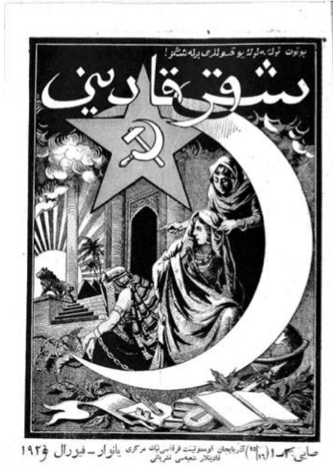
Şark Kadını Dergisinin Kasım 1923 Yılı İlk Sayısı