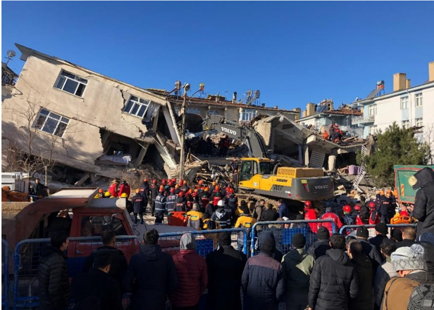
Foto 1. 24 Ocak 2020 Sivrice-Elazığ depreminde yıkılan Dilek Apartmanı.