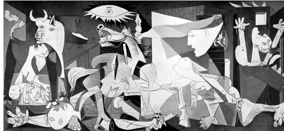
Görsel 1. Picasso, Guernica , 1937, Tuval Üzerine Yağlıboya, 349 cm × 776 cm,